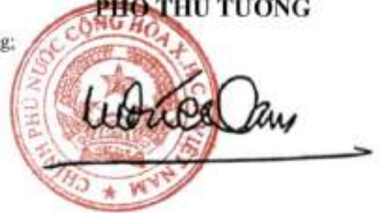
Vũ Đức Đam

TM. CHÍNH PHỦ KT. THỦ TƯỚNG PHÓ THỦ TƯỚNG